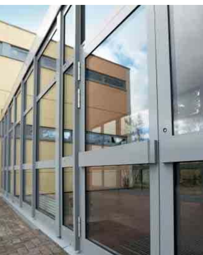
Schüco Aluminium-Türsystem ADS 50.NI Schüco Aluminium door system ADS 50.NI

Aluminium-Türsystem Aluminium Door System