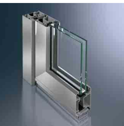
Schüco Tür ADS 65 RL Schüco Door ADS 65 RL