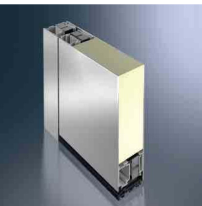
Schüco Türsystem ADS 75.SI Schüco door system ADS 75.SI