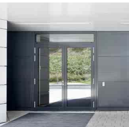
Schüco Aluminium-Türsystem ADS 75.SI Schüco Aluminium door system ADS 75.SI

Aluminium-Türsystem Aluminium Door System